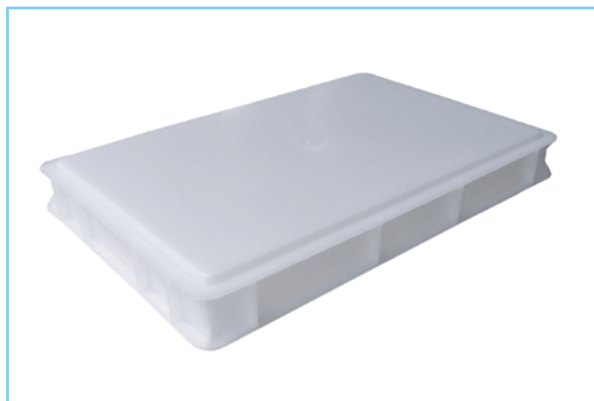
Particolare del fondo