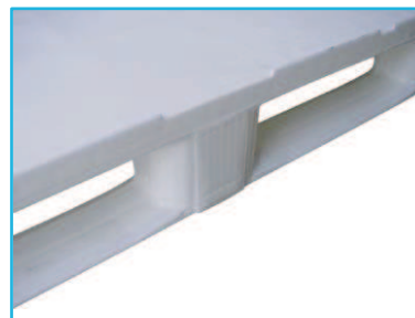
Particolare dei bordini perimetrali